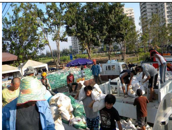
อาสาสมัครทำงานอย่างแข็งขันเพื่อเสริมแนวกันน้ำที่ประตู 5 สังเกตว่านักศึกษาของเราตอนนี้แข็งแรงมากยกที่ละสองกระสอบยังไหวเลย (17 พ.ย.)