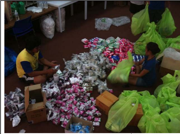
ทีมถุงยังชีพช่วยกันบรรจุของบริจาคเป็นถุงยังชีพ เพื่อให้ไปแจกจ่ายกับชุมชน (7 พ.ย.)