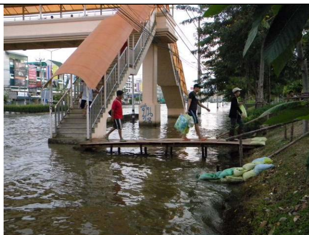
ทางเดินจากคันดินบริเวณประตู4 เพื่อให้ประชาชนใช้สัญจรข้ามสะพานลอยได้สะดวกตรงจุดนี้ต้องยกเครดิตให้ทีมงานจากคณะวิศวกรรมศาสตร์ (18 พ.ย.)