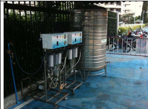
จุดบริการน้ำดื่มสะอาดให้ประชาชนนำภาชนะมากรอกรอกได้เองที่บริเวณประตู 5 ขอขอบคุณอาจารย์วิสิทธิ์ที่ประสานงานเครื่องกรองน้ำมาให้ (13 พ.ย.)