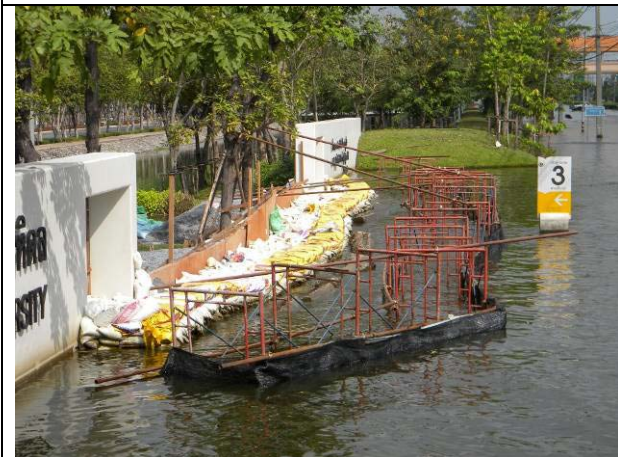
กำแพงกระสอบทรายพร้อมกำแพงกันคลื่นหน้าประตู 3 (17 พ.ย.)