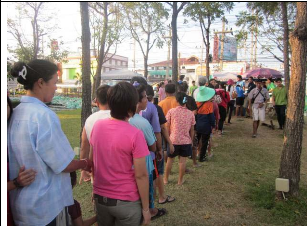
แฟนๆข้าวผัดยังเนืองแน่นเหมือนเคยเริ่มแจกตอน 17.00 น. โดยจะขอให้รับ1 คนต่อ1 ห่อก่อนเพื่อให้แน่ใจว่ามีข้าวเพียงพอสำหรับคนที่อุตสาห์ลยน้ำมารับข้าวทุกคนหลัง17.30 น. ถ้ายังมีข้าวพอใครจะรับไปฝากคนที่บ้านก็สามารถมารับเพิ่มได้(17 พ.ย.)