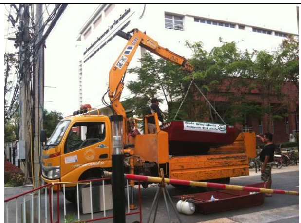
มหาวิทยาลัยยมมอบเรือเหล็กที่ได้รับบริจาคมา 6 ลำให้กับเทศบาลคลองโยง (13 พ.ย.)