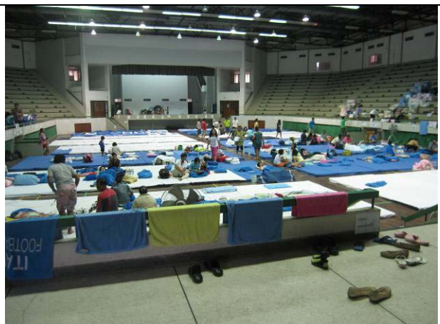
บรรยากาศภายในศูนย์พักพิงในวันที่สอง (22 ต.ค.)