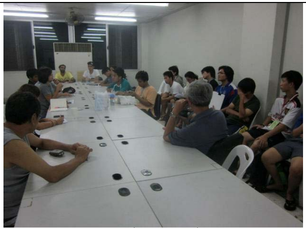
ประชุมอาสาสมัครเป็นประจำที่บ้านลีลาวดี เพื่อติดตามการทำงานแต่ละฝ่าย