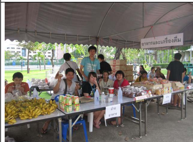
ฝ่ายอาหารและเครื่องดื่มให้บริการอยู่ด้านหน้าอาคารอเนกประสงค์ (22 ต.ค.)