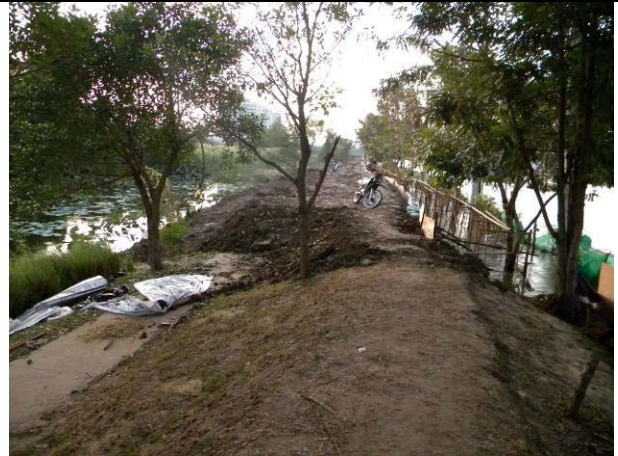
แนวคันดินฝั่งทิศเหนือก็เสริมความแข็งแรงเสร็จเรียบร้อย หายห่วงไป เยอะตรงจุดนี้เป็นจุดที่ซ้ำที่สุดเนื่องจากต้องถมดินลงในบ่อน้ำก่อนจึงจะเสริมคันดินได้ (17 พ.ย.)