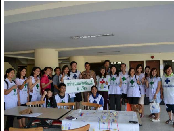
หน่วยแพทย์เคลื่อนที่ที่มาเปิดให้บริการที่คอนโด A มีทั้งแพทย์พยาบาล เภสัช และแม่แต่สัตวแพทย์ก็มี