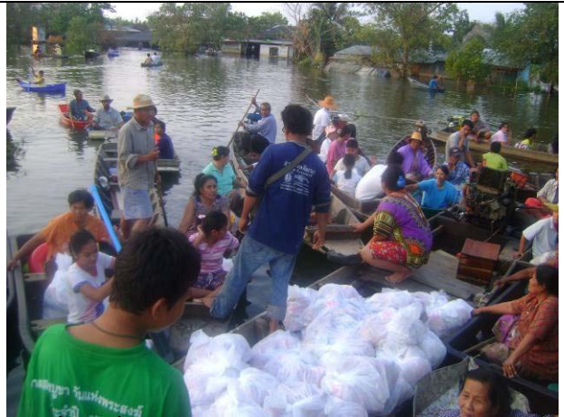
ทีมลงพื้นที่ลงพื้นที่ตำบลมหาสวัสดิ์ หมู่ 2 อำเภอพุทธมณฑล ริมคลองมหาสวัสดิ์ (25 พ.ย.)