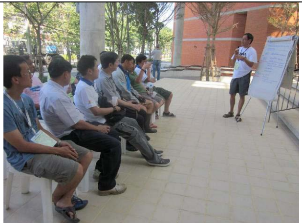
รองอธิการฯ รายงานอธิการบดีและคณบดีสถานการณ์น้ำท่วมและการดำเนินการของศูนย์ฯ