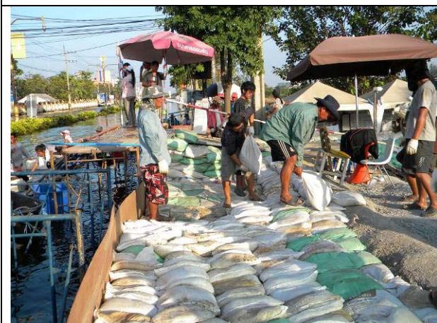
แนวกันน้ำหินคลุกหน้าประตู5 เริ่มมีน้ำซึมเข้ามามากขึ้น ฝายป้องกันน้ำไม่รอช้ารีบเสริมแนวคันกันน้ำเพื่อป้องกันหินคลุกพังทลาย (17 พ.ย.)