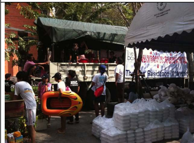
บ่อยครั้งที่ผู้บริจาคนำอาหารและสิ่งของมาให้เพิ่มเติมที่หน้าหอ 10