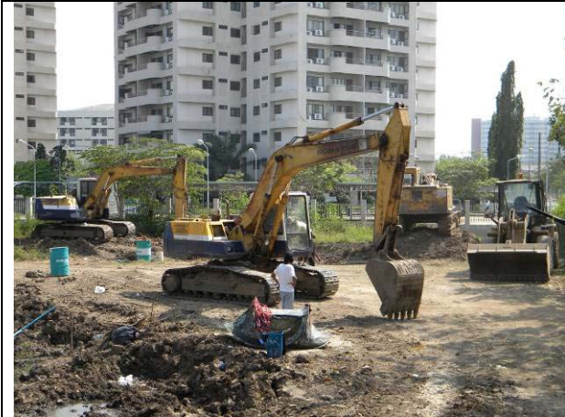
เครื่องจักรหนักถูกนำมาใช้งานป้องกันน้ำต้องระดมพลกันยกใหญ่เลย ได้เครื่องทุ่นแรงมติดเลยแข็งแรงขึ้น (17 พ.ย.)