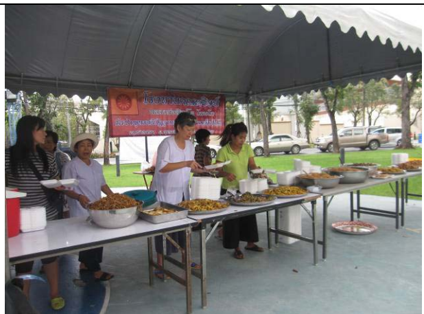
โรงงานที่ด้านหน้าอาคารอเนกประสงค์ (22 ต.ค.)