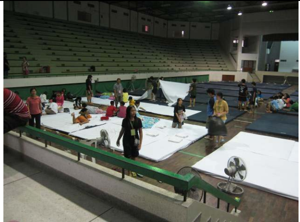
วันแรกของการรับผู้พักพิงที่อาคารอเนกประสงค์ อาสาสมัครกำลังช่วยจัดเตรียมที่นอน (21 พ.ย.)