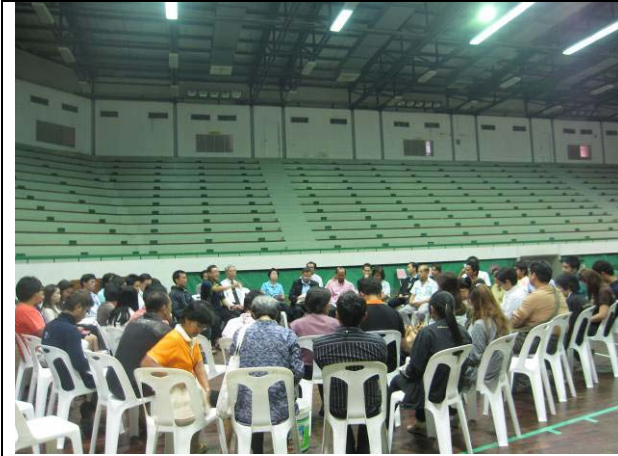
การประชุมเตรียมการร่วมกับผู้นำชุมชนในอำเภอพุทธมณฑล ก่อนเปิดศูนย์พักพิง (20 ต.ค.)