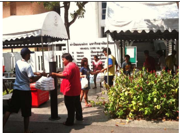
บรรยากาศประจำวันด้านหน้าหอ 10 ที่จะมีรถทหารมาส่งอาหาร เพื่อรอส่งต่อให้กับชุมชนเป็นประจำทุกวัน (10 พ.ย.)