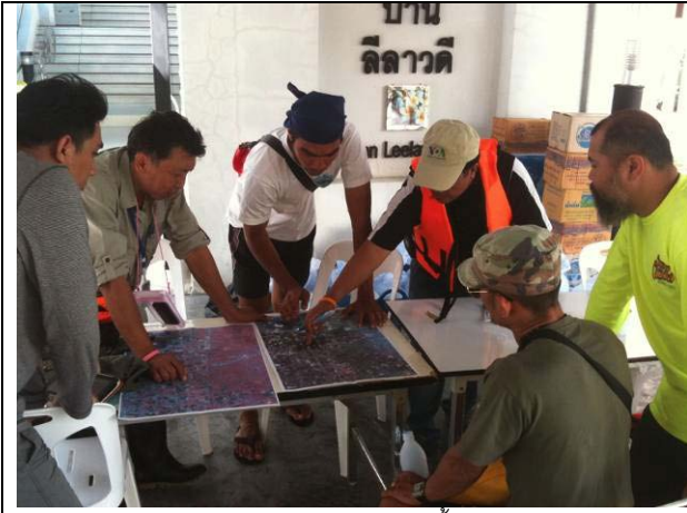
ทีมวิทยาศาสตร์เขตร้อนยังคงออกเก็บตัวอย่างน้ำรอบมหาวิทยาลัย นอกจากนี้ยังช่วยตรวจน้ำและกำจัดยูงในมหาวิทยาลัยด้วย (9 พ.ย.)