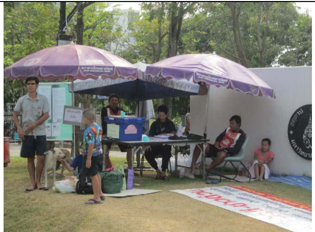
จุดรับแจ้งความชั่วคราวของสภ.อ.พุทธมณฑลที่บริเวณหน้าประตู 5 (12 พ.ย.) นอกจากนี้ตำรวจที่มาพักอยู่ที่บ้านสีลาวดี (หอ 10) สืบกว่าคนยังมีรถส่งผู้ต้องขังและเรือมาช่วยมหาวิทยาลัยชนสงคนและสิ่งของหลายครั้ง