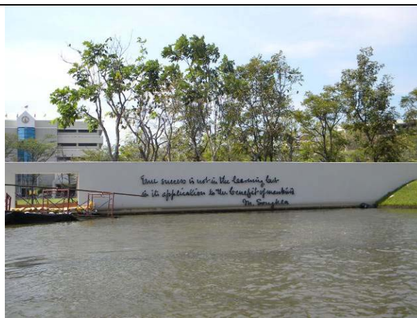
ดูจากรอยคราบน้ำ จะเห็นว่าระดับน้ำลดไปประมาณ 10-20 ซม. แต่ยังคงขุ่นๆ อยู่ (18 พ.ย.)