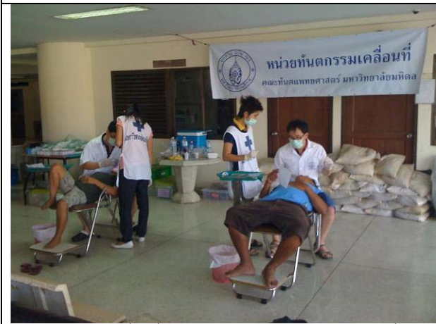
หน่วยทันตกรรมเคลื่อนที่ที่มาเปิดให้บริการพร้อมกับหน่วยแพทย์ที่ได้คอนโด A วันจันทร์ถึงศุกร์