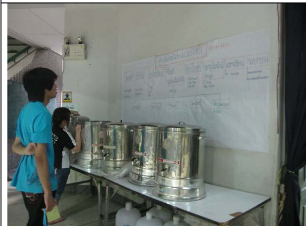
โครงสร้างการทำงานที่ได้จากการประชุมวางแผนและชื่ออาสาสมัครแกนนำที่เป็นผู้รับผิดชอบแต่ละฝ่าย (21 ต.ค.)