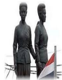
ท้าวเทพกษัตรี – ท้าวศรีสุนทร