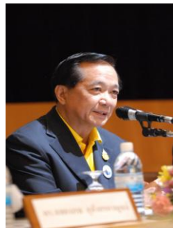
ศ.ดร.จีระ หงส์ลดารมภ์