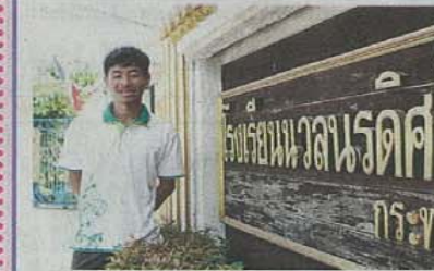
กับการจัด ค่ายอบรมกฎหมายสำหรับเด็กไร้สัญชาติ ที่โรงเรียนวชิรวิทย์ศึกษา ซึ่งมีคุณลาภเชก ใน

วันที่ 28-29 ส.ค. 2554 นี้ ยอดบอกว่า ค่าอบรมครั้งนี้จัดเป็นครั้งที่ 2 เดิมเป็นความคิดที่หวังจะแก้ไขปัญหาลูกหลานของตัวเอง แต่เห็นว่าก็มีน้อง ๆ ในโรงเรียนที่ประสบปัญหาเดียวกัน จึงจัดตั้งเป็นค่ายขึ้นมา "กิจกรรมก็จะมีมีการเชิญวิทยากรซึ่งเป็นผู้เชี่ยวชาญด้านกฎหมายสถานะบุคคลมาให้ความรู้ และมีการพาน้อง ๆ ออกไปทำกิจกรรมนอกสถานที่ อาทิ เที่ยววัดพระแก้ว ลงนามถวายพระพรพระบาทสมเด็จพระเจ้าอยู่หัว ที่โรงพยาบาลศิริราช และอาจจะไปขอขึ้นหนังสือถึงนายกฯ รัฐมนตรีคนใหม่ที่ทำเนียบรัฐบาลด้วย ซึ่งอยู่ระหว่างการติดต่อ"