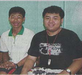
กับครุวิชานันท์ และเพื่อนชื่อขี้ตืดยะ

หรือเผ่า ดาราอั้ง เหตุที่เข้ามาทำงานในประเทศไทย เพราะมีญาติเข้ามาทำในประเทศไทย ก่อน ก็ชวนพี่มา ยอดก็ตามพ่อแม่เข้ามา เข้ามาอยู่ที่จังหวัดสมุทรสาครเป็นที่แรก