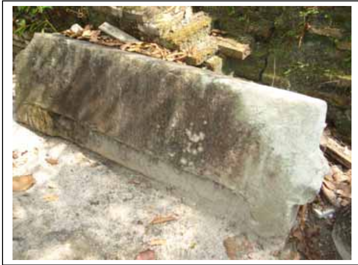
ภาพประกอบที่ ๑๗ ชิ้นส่วนสถาปัตยกรรมของเทวสถานที่ยังคงทิ้งไว้ในบริเวณวัดชายคลอง (วัดชลเจนียน)

๓. ศาสนสถาน ณ วัดชายคลอง (วัดชลเจนียน) ตำบลในเมือง อำเภอเมือง จังหวัดนครศรีธรรมราช เป็นศาสนสถานที่ตั้งอยู่ทางทิศตะวันตกของโบราณสถานวัดพระนคร ห่างออกมาประมาณ ๑๕๐ เมตร ปัจจุบันตั้งอยู่ภายในบริเวณวัดชายคลอง (วัดชลเจนียน) ซึ่งเป็นวัดที่ตั้งอยู่บริเวณภายนอกเขตกำแพงเมืองด้านตะวันตกของเมืองโบราณ ปัจจุบันเกือบจะไม่เหลือร่องรอยของการเคยเป็นเทวสถานโบราณอยู่เลย เพราะมีการก่อสร้างอาคารลงบนสถาปัตยกรรมรุ่นเก่า ทำให้มีการทำลายหลักฐานดังกล่าวไปมาก จะมีเพียง อิฐโบราณและชิ้นส่วนสถาปัตยกรรมที่ทำด้วยหินอยู่บ้าง