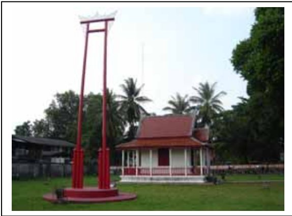
ภาพประกอบที่ ๒๓, ๒๔ เสาชิงช้า, หอพระอิศวร และ ศิวลึงค์ที่ประดิษฐานในหอพระอิศวร มีนาคม ๒๕๕๑

ประดิษฐานอยู่เป็นจำนวนมาก โดยเฉพาะศิวลึงค์และโยนิ จากประติมากรรมที่ยังคงปรากฏอยู่ในศาสนสถาน และร่องรอยของชิ้นส่วนของสถาปัตยกรรมที่ทำด้วยหินและอิฐโบราณที่ค้นพบในบริเวณนี้ โดยเฉพาะแท่งหินขนาดใหญ่หลายรูปแบบ อาจจะสันนิษฐานได้ว่า เป็นศาสนสถานที่เกี่ยวข้องกันกับศาสนสถานแห่งอื่น ๆ ในวัฒนธรรมเดียวกันในรัฐนี้ และได้ดำรงความสำคัญร่วมกันกับศาสนสถานในบริเวณใกล้เคียงกันนี้ต่อมาในระยะหลังอีกยาวนาน ในฐานะที่เป็นศูนย์กลางแห่งการประกอบพิธีกรรมที่เนื่องในศาสนาพราหมณ์ของชุมชน จนกระทั่งพิธีกรรมเหล่านั้นได้ถูกยกเลิกไป ทำให้บทบาทของศาสนสถานแห่งนี้ลดความสำคัญลงไปมาก