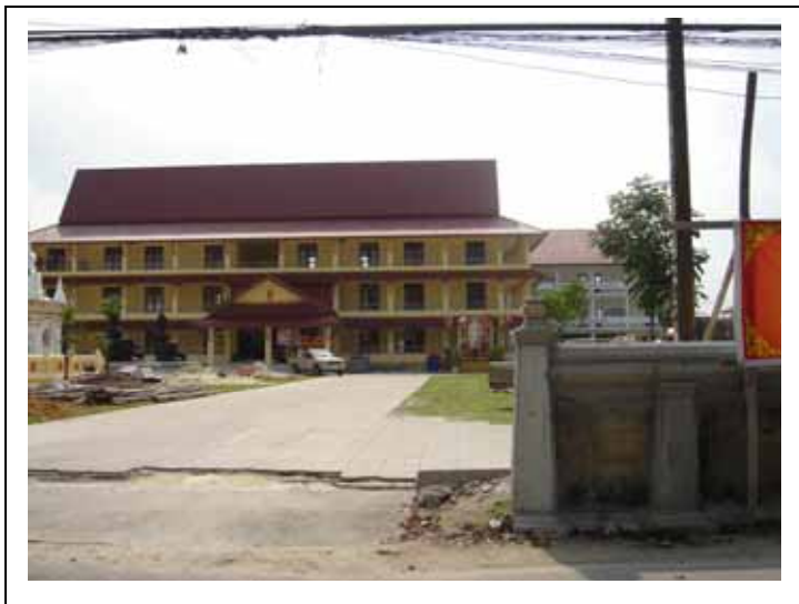
ภาพประกอบที่ ๑๖ ศาสนสถานวัดพระนคร ปัจจุบันได้มีการก่อสร้างอาคารหลายหลังภายในวัด

ปัจจุบัน (พ.ศ. ๒๕๕๑) บริเวณภายในวัดพระนครแห่งนี้ ได้มีการก่อสร้างอาคารใหม่ ๆ หลายหลังด้วยกัน เป็นทั้งอาคารของวัดและเป็นโรงเรียนมูลนิธิของวัด บางอาคารยังได้ใช้เป็นสถานที่เรียนของมหาวิทยาลัยมหามกุฏราชวิทยาลัย วิทยาเขตศรีธรรมโศกราช ด้วย