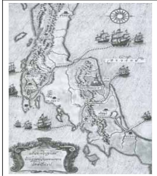
ภาพประกอบที่ ๓ เส้นทางค้าขายโบราณจาก อินเดีย – จีน เส้นทางลัดจาก ตะกั่วป่า จ.พังงา – อ่าว บ้านดอน จ. สุราษฎร์ธานี

การแพร่กระจายเข้ามาของศาสนาพราหมณ์ – ฮินดู ตามเส้นทางการค้าดังกล่าว ปรากฏร่องรอยของการแพร่กระจายทั้งที่เป็น โบราณสถานและโบราณวัตถุมากมายหลายแห่ง เช่น รูปเคารพของศาสนาพราหมณ์ เป็นเทวรูปรุ่นต้นของพระวิษณุ เทพเจ้าสูงสุดของศาสนาพราหมณ์ลัทธิไวษณพนิกาย ซึ่งเป็นพระวิษณุที่มีความเก่าแก่ที่สุดที่ค้นพบในเอเชียตะวันออกเฉียงใต้, เทวรูปอื่นๆ ที่ค้นพบในแหล่งโบราณคดีวัดศาลาทิง (วัดชยาราม) อำเภอไชยา จังหวัดสุราษฎร์ธานี แหล่งโบราณคดีหอพพระนารายณ์ อำเภอเมือง จังหวัดนครศรีธรรมราช และแหล่งโบราณคดีวัดพระพรัง อำเภอพระพรหม จังหวัดนครศรีธรรมราช เป็นต้น