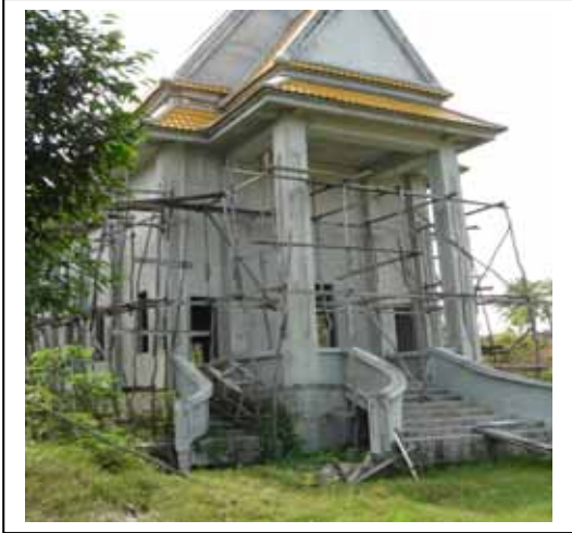
ภาพประกอบที่ ๑๘ บริเวณที่เคยเป็น สระน้ำโบราณในเทวสถานวัดชายคลอง (วัดชลเฉนิยณ) ปัจจุบันกำลังก่อสร้าง อุโบสถทับในบริเวณดังกล่าว