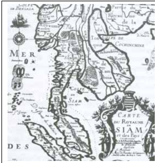
ภาพประกอบที่ ๒ เส้นทางค้าขายโบราณจาก อินเดีย – จีน ผ่านแหลมมลายู