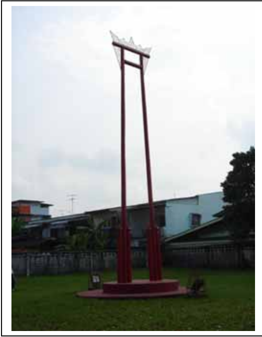
ภาพประกอบที่ ๒๒ เสาชิงช้า ในบริเวณหอพระอิศวร ต.ในเมือง อ.เมือง จ.นครศรีธรรมราช

ที่มีเนื้อแข็ง ลำต้นสูงใหญ่ จำนวน ๒ ต้น มาทำเสาชิงช้า โดยปักให้ส่วนปลายสอบเข้าหากันเล็กน้อย ส่วนยอดสุดมีไม้คานพาดไว้ พิธีกรรมโล้ชิงช้าเป็นพิธีกรรมที่สำคัญของเมือง มีการจัดต่อเนื่องกันมา โดยมีพิธีใหญ่ ๒ พิธี คือ พิธีตรียัมปวาย (ตรียัมปวาย) จัดขึ้นในคราวที่พระสีวะเสด็จลงมาเยี่ยมโลกมนุษย์ในวันขึ้น ๗ ค่ำ เดือนอ้าย และพิธีตรีปวาย (ตรีปวาย) จัดขึ้นในคราวที่พระวิษณุหรือพระนารายณ์เสด็จลงมาเยี่ยมโลกมนุษย์ในวันแรม ๑ ค่ำ เดือนอ้าย แต่พิธีนี้รัฐบาลให้ยกเลิกไปเมื่อ พ.ศ. ๒๔๖๗